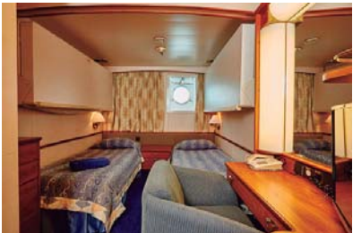
XB(cubierta 3,5 y 6)