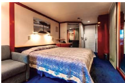
SB (cubierta 6)