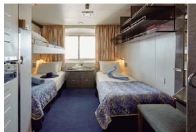
XC (cubierta 6)