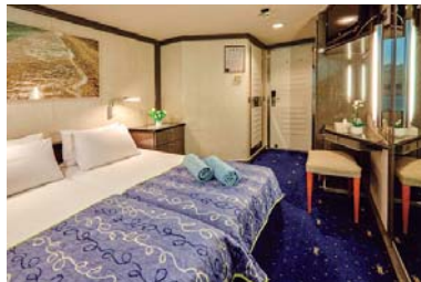
IB (cubierta 4 y 5)