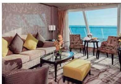
SG (cubierta 6)