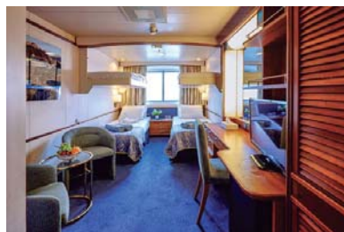
XC (cubierta 6)