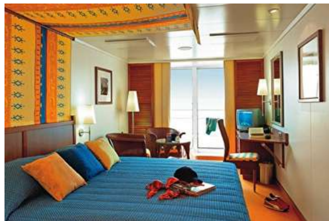
BA (cubierta 7)