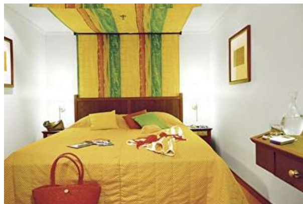
IA(cubiertas 4,5) hasta 4 pax