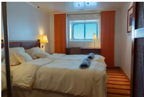
XA(cubierta 4,5) XB (cubierta 3,4,6) XBO (cubierta 6,7) XC (cubierta 4,5,6) XD (cubierta 5,7)

XD en las cubiertas 5 y 7(aprox. 17 m2) con capacidad para 3 personas, baño con ducha, aire acondicionado, teléfono, secador, caja fuerte, TV y ventana.