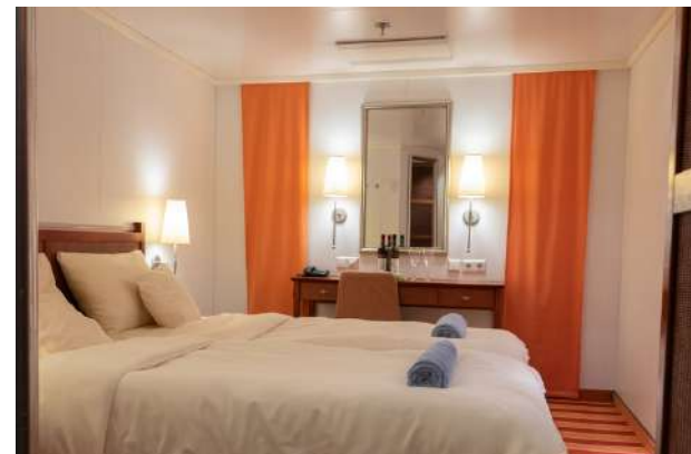
IB (cubierta 4 y 5) hasta 2 pax